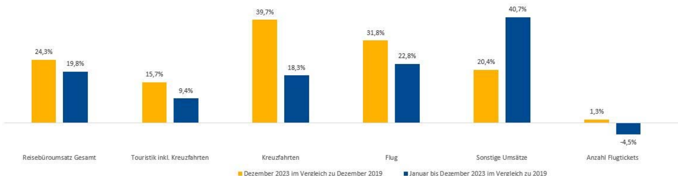
Fakturierte Werte Januar bis Dezember 2023 vs. 2019

Die Anzahl der Tickets liegt im Dezember mit plus 1,3% leicht über den Werten von 2019, kumuliert liegt der Wert bei minus 4,5%. Ab Januar 2024 gilt auch für die fakturierten Werte 2023 als neues Referenzjahr.